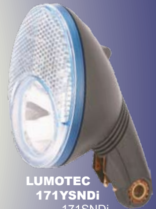
LUMOTEC 171YSNDi 171SNDi 170Di 171YDi 171Di 170N 170.....