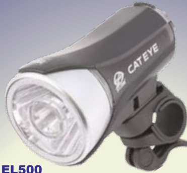
HL EL500 HL EL510 HL EL530