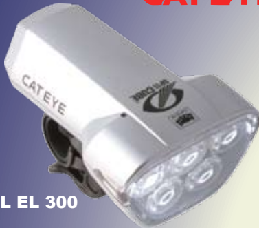
HL EL 300