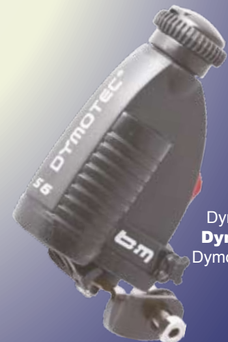
Dymotec 6 Dymotec S6 Dymotec S12