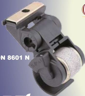
UNION 8601 N

Route de Montrevel - 01190 PONT DE VAUX - FRANCE