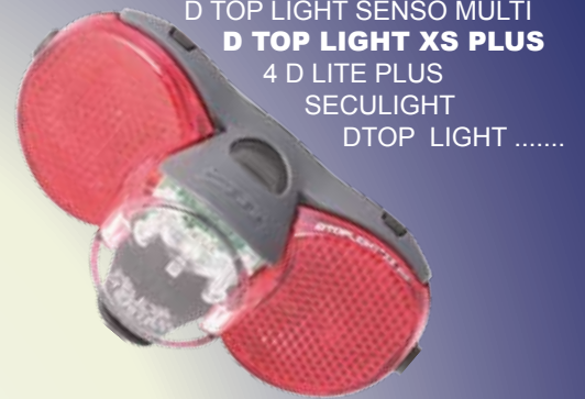
D TOP LIGHT SENSO MULTI D TOP LIGHT XS PLUS 4 D LITE PLUS SECULIGHT D TOP LIGHT .....