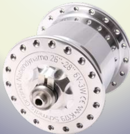
SON 26 - 28 SON 16 - 20