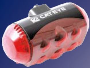
TD LD1000 TD LD600 TD LD120R